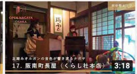
【17_阪南町長屋】オープンナガヤ大阪2020