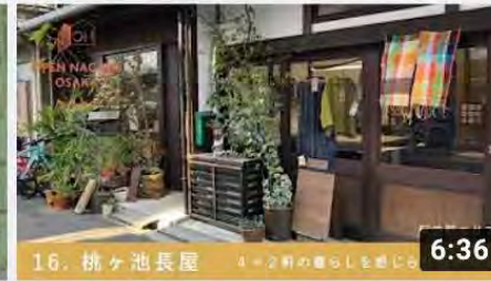
【16_桃ヶ池長屋】オープンナガヤ大阪2020