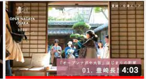
【01_豊崎長屋主屋】オープンナガヤ大阪2020