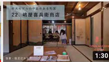
【22_嶋屋喜兵衛商店】オープンナガヤ大阪2020