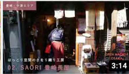
【02_SAORI豊崎長屋】オープンナガヤ大阪2020