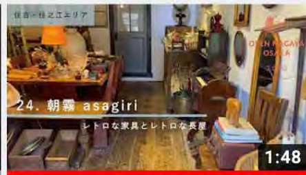
【24_朝霧asagiri】オープンナガヤ大阪2020