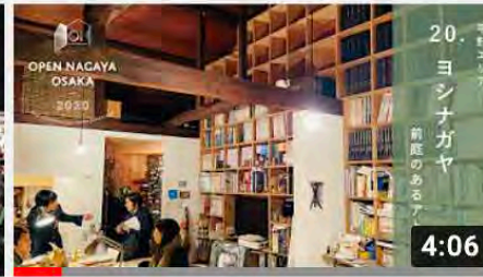
【20_ヨシナガヤ】オープンナガヤ大阪2020