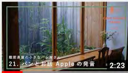
【21_パンとお話Appleの発音】オープンナガヤ大阪2020