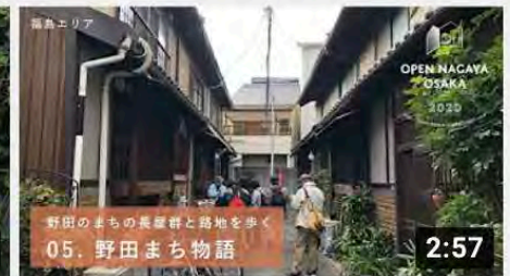
【05_野田まち物語】オープンナガヤ大阪2020