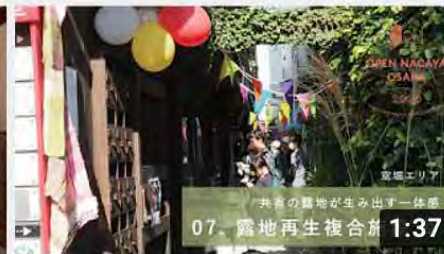
【07_露地再生複合施設 幸-つかさ-】オープンナガヤ大...