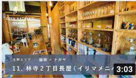
【11_林寺2丁目長屋】オープンナガヤ大阪2020