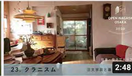
【23_クラニスム】オープンナガヤ大阪2020