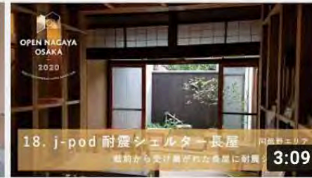
【18_j pod耐震シェルター長屋】オープンナガヤ大阪2020