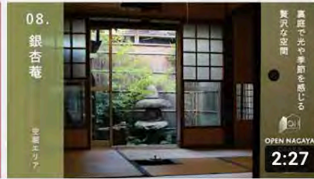
【08_银杏菴】オープンナガヤ大阪2020